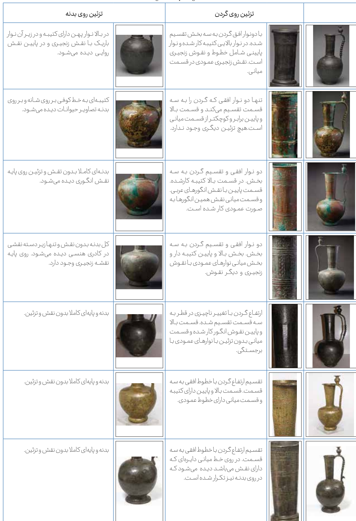
Table 2. Investigation of pomegranate catchments