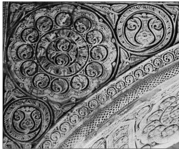
تصویر شماره ۳. نقش انار در تزئینات مسجد جامع نائین. Picture No. 3. The role of pomegranate in the decoration of Nain Mosque

سوم و چهارم هجری نقش انار در میان برگچه‌هایی ساده شده قرار گرفته که به نظر می‌رسد صورت ساده‌شده نقش انار در میان برگ کنگر دوره ساسانی باشد که پیش‌تر بررسی شد (تصویر ۴). در ظروف سفالین سده پنجم و ششم نیز از این نقش کم‌وبیش استفاده شده است. برای نمونه در آبریزی منسوب به دوره سلجوقی این نقش در اندازه‌ای نسبتاً بزرگ بر روی بدنه بال‌عاب قهوه‌ای رنگ پنج مرتبه تکرار شده است. درون این نقش نقطه‌های ریز هاشورمانندی است که به دانه‌های انار شباهت دارد و بوجه مفهوم تکثیر و باروری این نقش تأکید می‌کند.