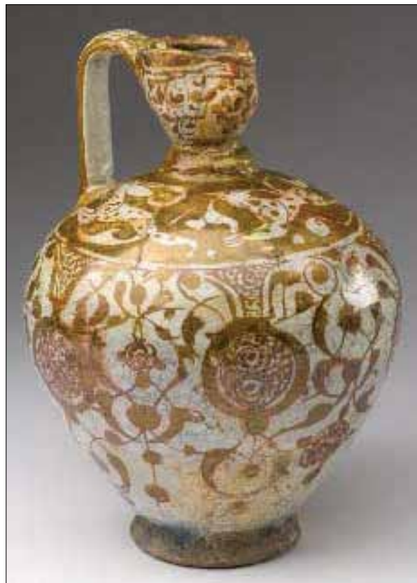
تصویر شماره ۵. نقش انار بر روی آبریز سفالی، قرن ۱۲-۱۳ میلادی/ قرن ۶ و ۷ هجری قمری، برلین: موزه استالین. Picture number 5 The role of pomegranate on a clay pot, 13th-12th century AD / 6th and 7th centuries AH, Berlin: Stalin Museum

پس از اسلام نیز نمونه‌هایی از آن را در تزئین ظروف سفالی می‌توان مشاهده کرد. در بشقاب منسوب به سده سوم و چهارم هجری نقش انار در میان برگچه‌هایی ساده شده قرار گرفته که به نظر می‌رسد صورت ساده‌شده نقش انار در میان برگ کنگر دوره ساسانی باشد که پیش‌تر بررسی شد (تصویر ۴). در ظروف سفالین سده پنجم و ششم نیز از این نقش کم‌وبیش استفاده شده است. برای نمونه در آبریزی منسوب به دوره سلجوقی این نقش در اندازه‌ای نسبتاً بزرگ بر روی بدنه بال‌عاب قهوه‌ای رنگ پنج مرتبه تکرار شده است. درون این نقش نقطه‌های ریز هاشورمانندی است که به دانه‌های انار شباهت دارد و بوجه مفهوم تکثیر و باروری این نقش تأکید می‌کند.