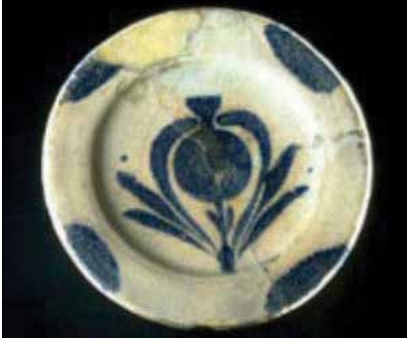
تصویر شماره ۴. نقش انار بر روی بشقاب سفالین لعاب‌دار با تزئین آبی و سفید کبالتی، شوش، قرن ۳-۴ هجری قمری. پاریس: موزه لوور مأخذ: (صالحی کاخکی و دیگران، ۱۳۹۲: ۳) Figure 4. Pomegranate pattern on glazed pottery plate decorated with cobalt blue and white, Susa, 34-th century AH. Paris: Louvre Museum Source: (Salehi Kakhki et al., 2013: 3)

انار را دارند. همچنین همانند آبریزهای فلزی این نوشتار، فرم کلی این ظرف نیز بی‌شبهت به شکل انار نیست. (تصویر ۵).