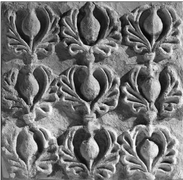
تصویر شماره ۲. نقش انار در میان برگ‌های متقارن، گچ‌بری‌های کاخ تیسفون، نیویورک، موزه متروپلیتن.