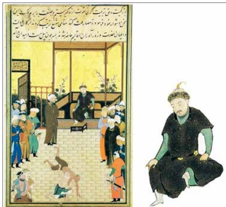
تصویر ۳: (دو کشتی گیر)، گلستان سعدی، هرات ۸۹۱ ه.ق.، (سودآور ۱۳۸۰: ۱۰۴) Picture 3: "Two wrestlers", Golestan Saadi, Herat 891 AH (Soodavar 2001: 104)

رنگ سبز و کمربندی به رنگ مشکی به تن دارد که لباس زیرین رانه به طور کامل اما پوشانده و بر جلوه لباس افزوده است و تاجی به سر دارد شبیه آنچه عموماً در نگاره‌ها بر