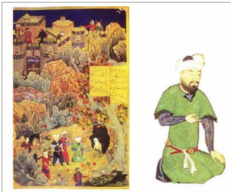
تصویر ۶: «اسکندر و معتکف»، خمسه نظامی، هرات (آزند، ۱۳۸۷: ۴۰۶) Picture 6: "Alexander and Motakaf", Khamseh Nezami, Herat (Azhand, 2008: 406)

در نگاره موجود است (تاج پادشاه در سمت راست نگاره در دست صاحب منصبی است) گویی نگارگر قصد داشته بی میلی شاه را به زرق و برق سلطنت بیان نماید.