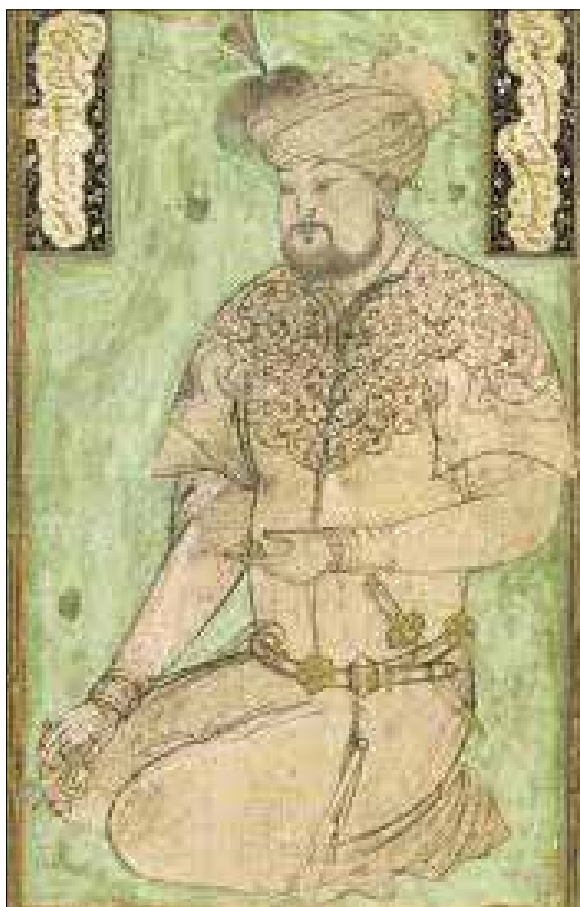
تصویر ۹: «سلطان حسین بایقرا»، رقعہ نگاری، اثر بهزاد (کنبی، ۱۳۷۷: ۱۹۰) Picture 9: "Sultan Hossein Bayqara", Raqqa painting, by Behzad (Canby 2005: 190)

۱۳۸۵: ۱۶۶). بدیهی است که در چنین شرایطی کمیت آثار و متون دینی افزایش می‌یابد و تأثیر خود را بر روی سایر جریان‌های فکری و هنری خواهد گذارد. شاید به جرئت بتوان ادعا کرد در کمتر دوره‌ای این تعداد از شاعران و گویندگان فارسی‌زبان می‌زیسته‌اند. در این زمان سرودن شعر فقط به شاعران نامی محدود نمی‌شد، بلکه گروه‌های مختلفی اعم از شاهان و شاهزادگان و وزیران و هنرمندان دستی در شعر داشتند. برخی از هنرمندان چند هنری بودند و به نحوی با ادب پارسی سروکار داشتند. اصطلاحات عرفانی به شدت در اشعار و آثار صاحبان ذوق و ادب این دوره وارد شد. در قرن نهم و دهم هجری کمتر شاعر و یا هنرمندی را می‌بینیم که از ذوق عرفانی بی‌بهره مانده باشد و جلوه‌هایی از آن در آثارش دیده نشود. جامی با توجه به ارتباط صمیمانه‌ای که به عنوان نماینده فرقه نقشبندی با دربار هرات به‌ویژه امیرعلی شیرنوایی داشت، همچنین بنا به مقام علمی و ادبی خود، تأثیر فراوانی بر طرز تفکر درباریان و هنرمندانی که به آنان