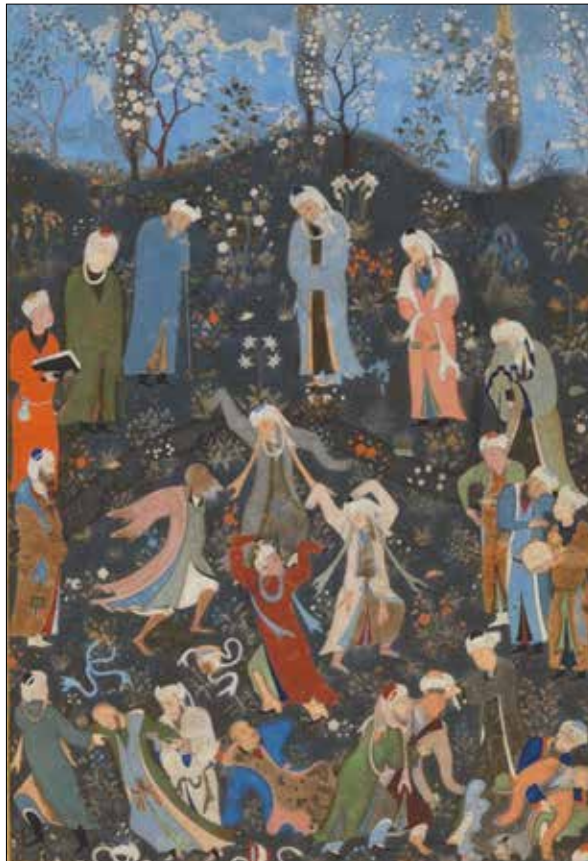
تصویر شماره ۱: «سماع درویشان»، منسوب به بهزاد (کنبی، ۱۳۷۷: ۱۷۸) Picture No. 1: "Sama_e Daravish" attributed to Behzad (Canby, 2005: 178)

چنان که مشاهده می‌گردد؛ نوع جلوس هرمز شاه به شیوه آثار عصر شاه‌رخ و به تقلید از شخصیت تیمور است. در این نگاره‌ها عموماً شاه یک پای خود را جمع کرده