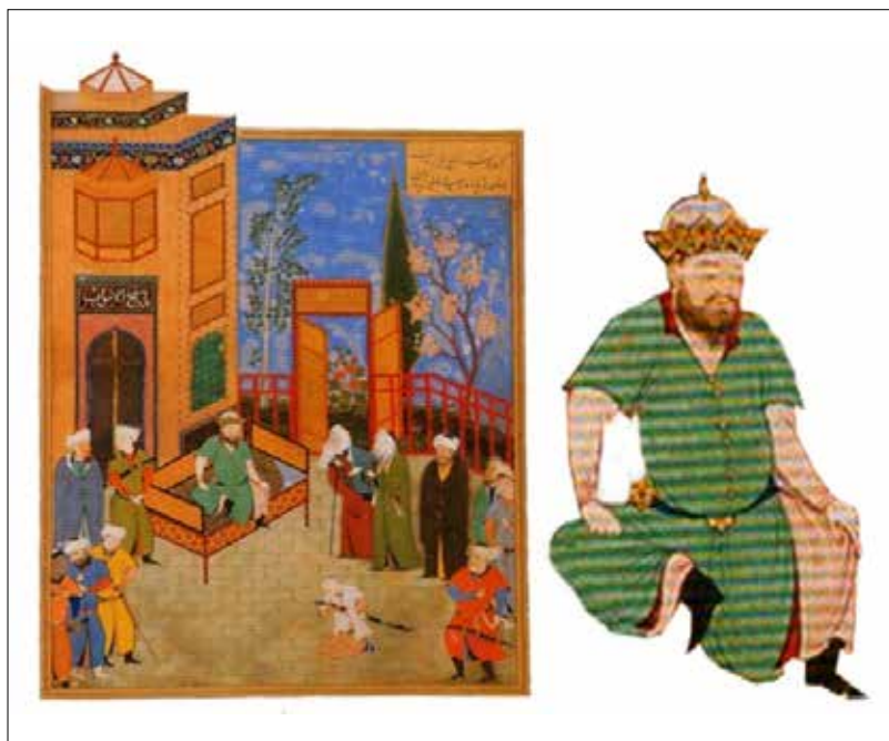
تصویر شماره ۲: (نگاره کفن پوشیدن خسرو)، منسوب به بهزاد (کنبی، ۱۳۷۷: ۱۷۸) Picture No. 2: "Khosrow wearing a shroud" attributed to Behzad (Canby 2005: 178)