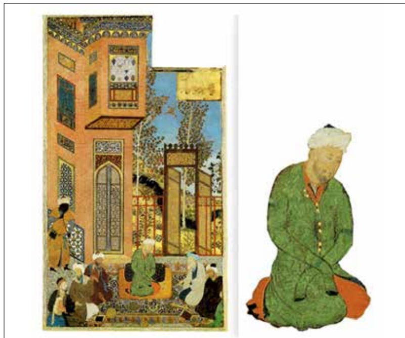
تصویر ۴: (تولد یک شاهزاده)، هرات ۸۸۴ ه.ق، منسوب به بهزاد، (سودآور، ۱۳۸۰: ۹۹).

خانقاه‌ها و معابد با ترکیه نفس خود را برای مقابله با نفس آماده می‌کردند و پهلوانان نیز در زورخانه‌ها با تقویت قوای جسمانی آماده مبارزه با دشمن بیرونی و درونی می‌شدند (Arthur.E.1944: 56). در بعضی از تصاویر جلوس شاهانه، شاهی بدون مشخص بودن هویت آن، به تصویر درآمده تا حکایت یا داستانی به کمک او در نگاره نقل گردد. به طور مثال در نگاره "دو کشتی‌گیر" پادشاهی که بر تخت نشسته مشخص نمی‌باشد. در این نگاره پادشاه زیر سایبانی جلوس کرده و شخصی که در سمت راست و نزدیک وی ایستاده احتمالاً وزیر وی می‌باشد که دستار بر سر دارد. در میان درباریان شخصی با تاج و لباسی با آستین‌های بلند، همچون لباس صوفیان، دیده می‌شود که به احتمال زیاد شاهزاده (نایب‌السلطنه) باشد. شاه تاج بر سر گذارده، یک پایش را جمع کرده و لباسی که آستین‌های آن به رنگ سبز می‌باشد، پوشیده است. احتمال دارد