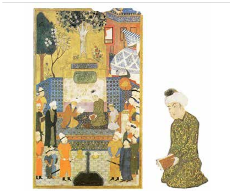
تصویر ۷: «تاج‌گذاری سلطان حسین باقرا»، هرات ۸۷۳ ه.ق، منسوب به منصور (سودآور ۱۳۸۰: ۸۷) Picture 7: "Coronation of Sultan Hussein Bayqara", Herat 873 AH, attributed to Mansour (Soodavar 2001: 87)

فاصله ایجاد نموده است. برخی از شنوندگان در این نگاره، از آوای موسیقی واله و شیدا شده‌اند، یکی از هوش‌رفته و دیگری جامه چاک می‌دهد که به مجلس سماع درویشان اشاره دارد، یکی از آیین‌هایی صوفیان که شاه شخصاً در آن حضور پیدا کرده