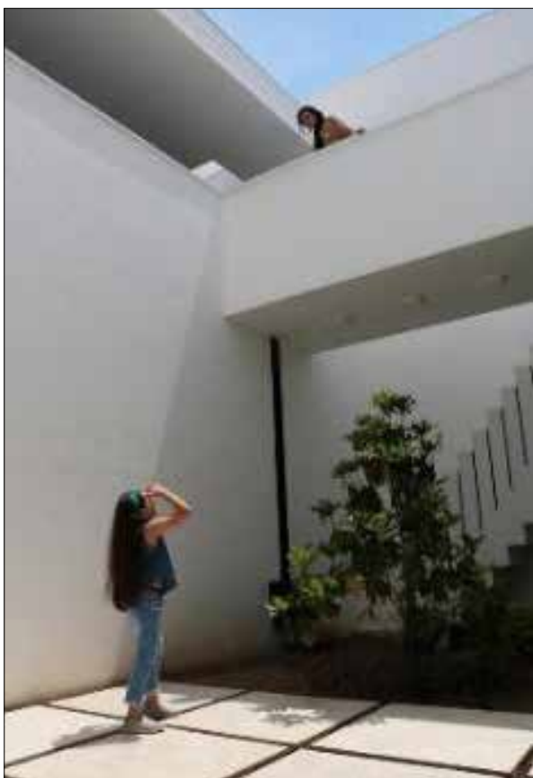
تصویر ۹: حیاط مرکزی واقع در پروژه.