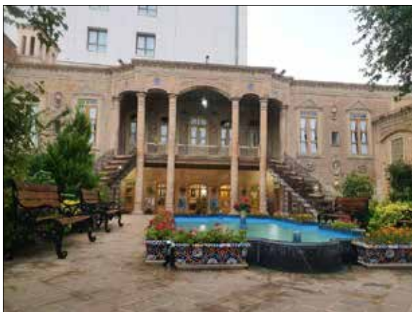
تصویر ۲: میان‌سرا و نمائ دو اشکوبه خانه داروغه. Figure 2: The mezzanine and the view of the two floors of the drug house.