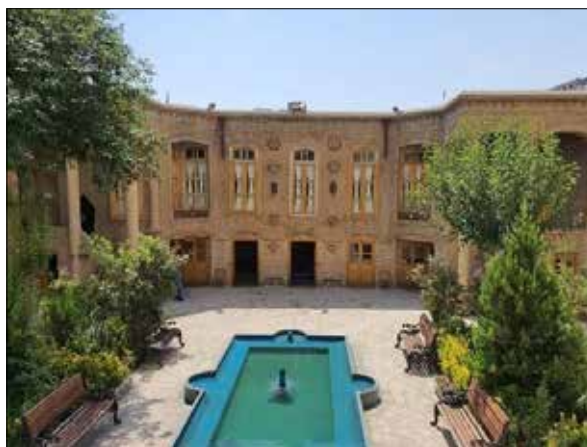
تصویر ۳: زمستان نشین. Figure 3: Winter dwelling.

و نمی‌توان به یکباره وارد اندرون خانه شد. هشتی این خانه به صورت چهارگوش و بعد از پیشگاه قرار دارد. پس از فضای هشتی، بخش روباز و بی‌آسمانه خانه یعنی میان‌سرا واقع است که در میان‌سرا جای داشته و اتاق‌های گوناگون پیرامون آن قرار گرفته و رو به آن باز می‌شده‌اند (همان: ۱۳) (تصویر شماره ۲).