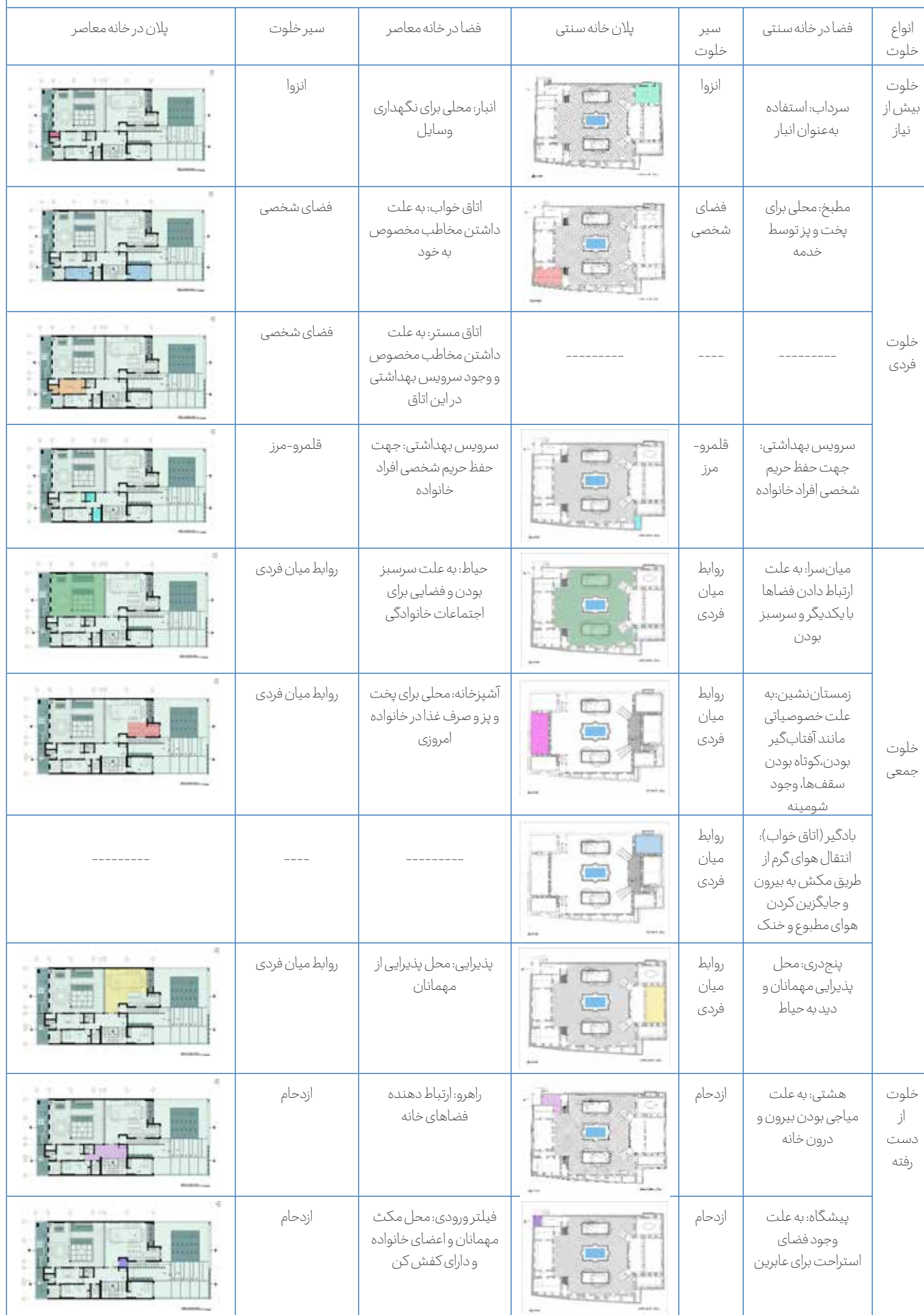
Table 4: Research Findings.