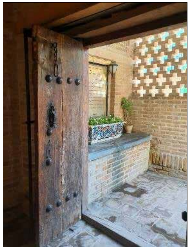
تصویر ۱: پیشگاه و سکوی پاخره. Figure 1: Front and foot platform.

خانه‌های ایرانی با تقلید از تحولات معماری مدرن غربی، اهمیت و تحقق یافته است. در این دوره به هریک از اعضای خانواده، فضاهای فردی اختصاص یافته و این امر موجب ارتقاء هویت فردی شده است. اما با یکپارچه‌سازی فضاهای خلوت جمعی، تنوع و قوام آن‌ها از بین رفته است و در معماری معاصر، فضاهایی همچون پذیرایی، اتاق نشیمن و حتی آشپزخانه، به‌عنوان یک اتاق یا فضای خصوصی از جداسازی و تفکیک لازم برخوردار نیستند (قاسم‌زاده، ۱۳۸۹: ۷). بعد از جنگ جهانی دوم در دنیای غرب، فضاهای عمومی و خصوصی به هم نزدیک‌تر شدند؛ بنابراین فضاهای واسط بین فضای بیرون و درون خانه، یا همان فضاهای بینابینی در خانه‌ها از بین رفته است. از طرفی، با طراحی اتاق‌های شخصی برای هر فرد، جداسازی اتاق فرزندان از پدر و مادر و سپس جدایی اتاق‌های فرزندان از یکدیگر، بین افراد خانواده نیز مرزی ایجاد شده است؛ بنابراین گرچه در این نوع معماری، فضای بینابینی از بین رفته و سالن پذیرایی و مهمان‌خانه و حتی آشپزخانه به هم نزدیک شده و حتی درهم ادغام شده‌اند، اما فضای خصوصی افراد خانواده به‌صورت فردی مدنظر قرار گرفته