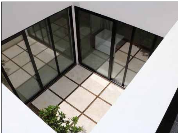
تصویر شماره ۸: حیاط مرکزی واقع در پروژه.