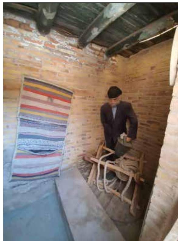
تصویر ۵: آب‌انبار. Figure 5: Water storage.

پس از پیشگاه هشتی قرار دارد. هشتی، فضایی مابین بیرون و درون خانه است، زیرا فضای درون خانه حریم دارد