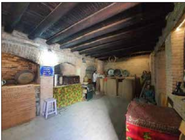
تصویر ۴: مطبخ. Figure 4: Kitchen.