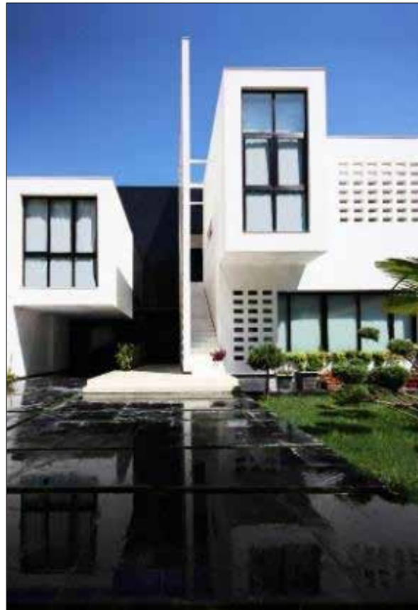
تصویر ۷: نمای کلی خانه پدر و دختر.

در خصوص شناسایی طیف خلوت فردی تا خلوت جمعی، ابتدا مدل مفهومی این پژوهش تدوین گشت. سپس در گام بعدی نحوه شکل‌گیری خلوت فردی تا خلوت جمعی در خانه‌های سنتی و معاصر مورد بررسی قرار گرفت و در گام آخر