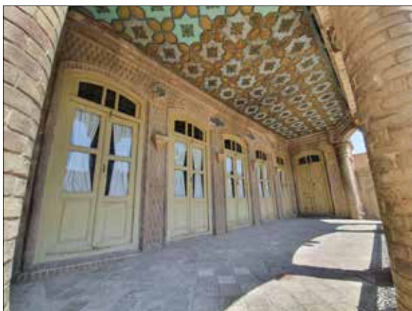
تصویر ۶: پنج‌دری. Figure 6: Panjdari.