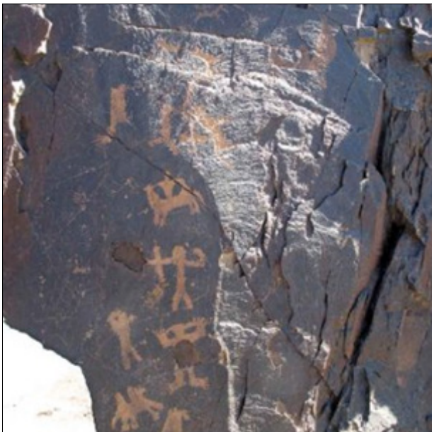
تصویر ۹- نقوش انسانی با دستهای باز در دره نگاران

سومین صحنه مجزای دره نگاران که در ابتدای دره و روی صخره‌های شرق دره ایجاد شده‌اند، شامل نقوش انسان اسب‌سوار، انسان پیاده کماندار و بدون کمان و نقوش حیوانی از قبیل بزکوهی است. نکته ویژه این صحنه درباره