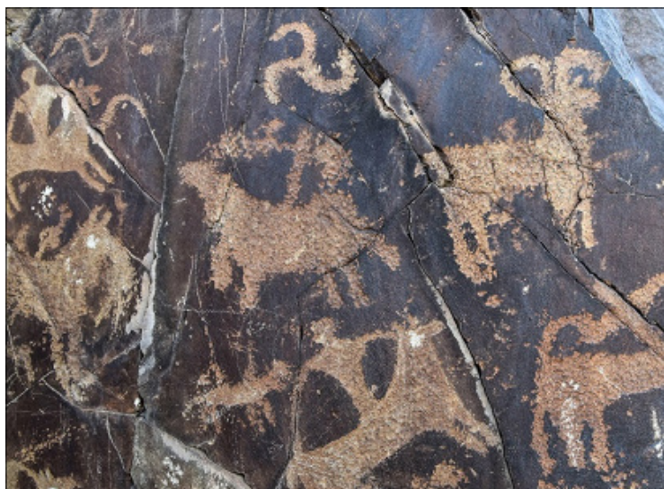
تصویر ۱۶- نقش صلیب شکسته در قسمت فوقانی صخره در دره نگاران