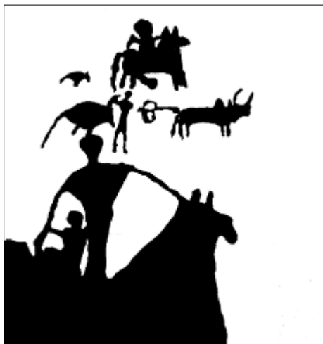
تصویر ۱۳- طرح بازسازی شده نقش قسمت شرقی دره نگاران