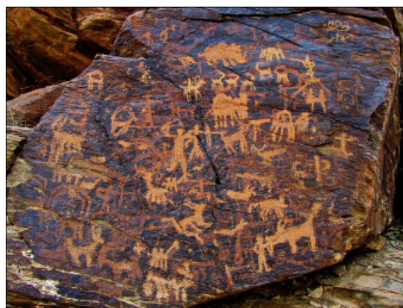
تصویر ۲- تراکم نقوش صخره‌ای در دره نگاران

بستری که نقوش روی آن‌ها پیاده شده سطح سختی است که بدون ابزارهای سنگی و فلزی انجام‌پذیر نیست و برای ایجاد هر کدام از نقوش و صحنه‌ها لایه بسیار نازکی از سطح سنگ به‌طور کامل و یکنواخت برداشته شده است. دقت ضربات به‌گونه‌ای است که خطوط منحنی بدن حیوان با انسان به‌خوبی کشیده شده و خارج از حریم نقش نیز هیچ ضربه‌ای که ناشی از بی‌دقتی باشد وجود ندارد (تصویر ۲).