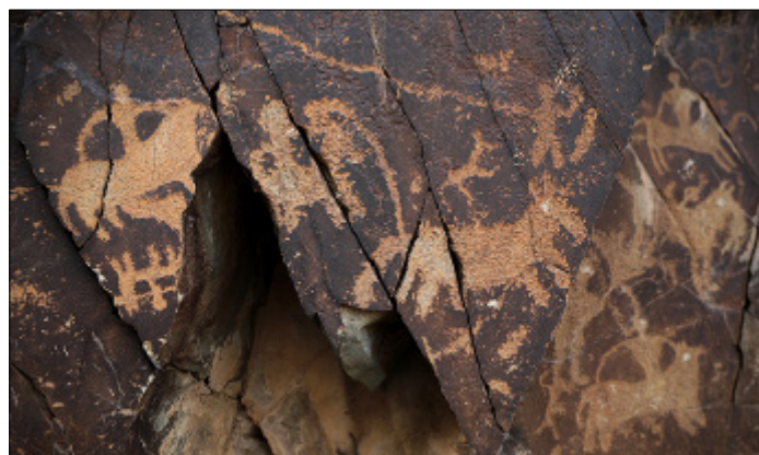
تصویر ۶- بخشی از صحنه جنگ در نقوش دره نگاران

Picture 5- The battle scene in Darehnagaran motifs