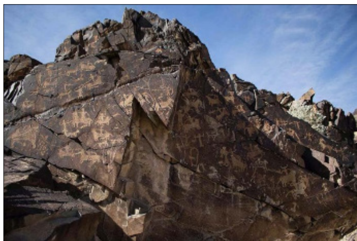
تصویر ۵- صحنه جنگ در نقوش دره نگاران

طبیعی سنگ‌ها ترک برداشته یا بخشی از آن‌ها فروریخته‌اند. از طرف دیگر در سال‌های اخیر روی بسیاری از آن‌ها یادگاری‌هایی حک شده که چهره صحنه اصلی را مخدوش کرده‌اند؛ اما احتمالاً این صحنه به دلیل قرار گرفتن در ارتفاع بیشتری نسبت به سطح و قرار نگرفتن در دره اصلی (دور از چشم بودن) از تخریب‌های انسانی در امان مانده و دچار فرسایش طبیعی نیز نشده است. این سنگ‌نگاره صحنه کاملی از جنگ و شکار است که نقوش به صورت فشرده در سطحی به ابعاد ۱۲۰ x ۱۵۰ سانتی‌متر ایجاد شده‌اند (تصاویر ۵ و ۶). صحنه از دو ترکیب انسان‌های سوار بر اسب و انسان‌های پیاده کمان به دست تشکیل شده است که مشابه سنگ‌نگاره قبلی