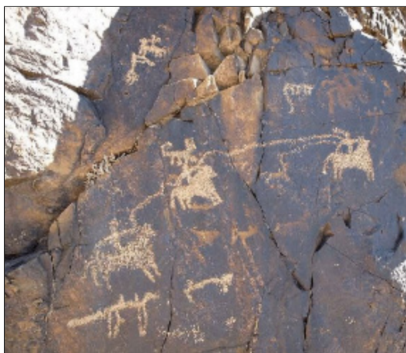
تصویر ۴- خطوط اتصال میان پیکره‌ها در نقوش دره نگاران

با توجه به تکرار شدن این‌گونه خط‌های متصل‌کننده در دره نگاران، به نظر می‌رسد هنرمند سعی کرده با ایجاد خطوط اضافی امتداد مسیر یک تیر یا نیزه تا هدف نهایی را ترسیم کند. هرچند در این باره نمی‌توان نشانی از آلات جنگ یا شکار پیدا کرد (تصویر ۴).