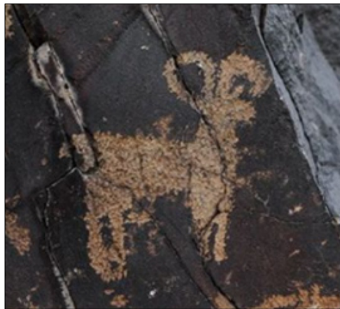
تصویر ۲۰- نقش قوچ کوهی در سنگ‌نگاره‌های دره نگاران

قصه‌هایی می‌ساخت و برای فرزندانش خود تعریف می‌نمود و در قدرت حیوانات مبالغه می‌کرد تا قدرت خود را در غلبه بر او به نمایش بگذارد. در آغاز تصاویر آن‌ها را بر صخره‌ها و دیوار غارها حک می‌کرد نه برای آفرینش هنری، بلکه تا مقصود خود را به هم نوعش بیان دارد. از چوب و سنگ پیکره‌هایی از حیوانات می‌تراشید. بر پارچه‌ها، فرش‌ها و خیمه‌ها تصاویر آن‌ها را رسم می‌کرد. گاه تصاویری که رسم می‌نمود مانند توضیحات قصه‌ها واقعی نبودند، آن تصاویر بیش از آن‌که نشانه‌های عظمت و بزرگی حیوانات باشد، حکایت از تخیل خلاق آفریننده آن‌ها داشت»