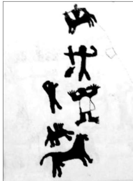
تصویر ۸- طرح آنالیز شده نقش انسان با دستان باز در دره نگاران