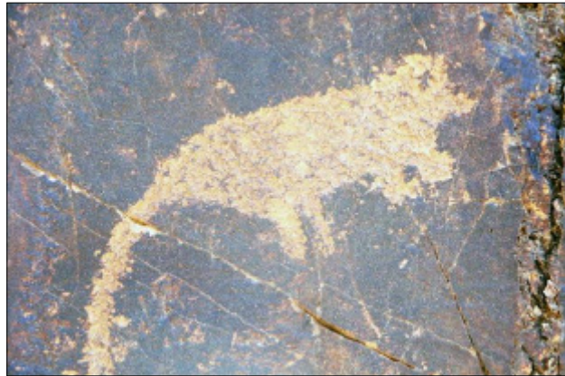
تصویر ۲۲- نقش حیوانی شبیه خوک وحشی در سنگ‌نگاره‌های دره نگاران