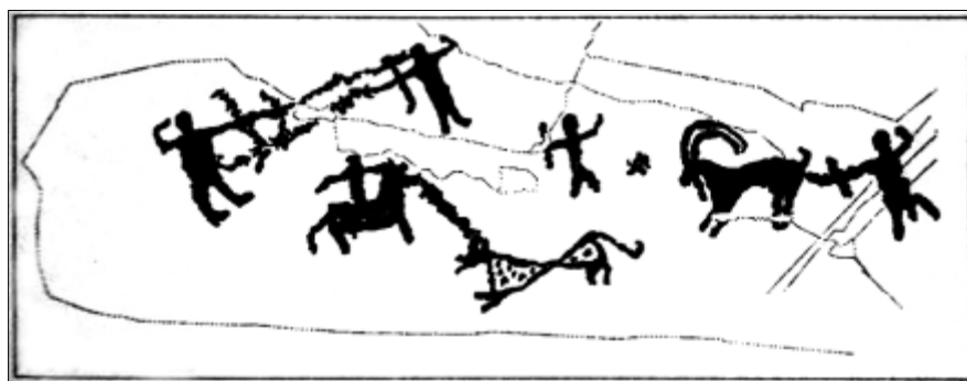
تصویر ۱۹- طرح آنالیز خطی نگاره قبلی