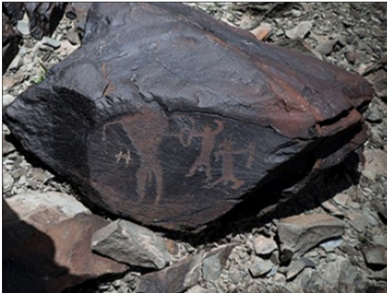
تصویر ۲۵- دو انسان در حال مبارزه با موجودی غول پیکر در سنگ‌نگاره‌های دره نگاران

از دیگر نقوشی که دارای بسامد نسبتاً بالایی در سنگ‌نگاره‌های دره نگاران می‌باشند ابزارآلات هستند. این عکس‌های ماقبل تاریخی، آدم را با ابزارهایش، هیئت و شمایل و ژست‌هایش، شکارها و شکارگاه‌هایش باهم نشان می‌دهند. در این سنگ‌نگاره‌ها نیز ابزار و ابزاری ساز و شیوه استفاده از ابزار، باهم تصویر شده‌اند.