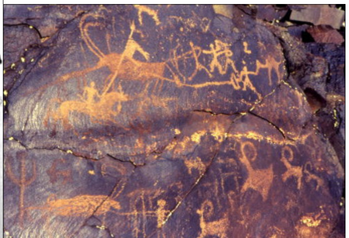
تصویر ۱۰- صحنه شکار اسب در دره نگاران