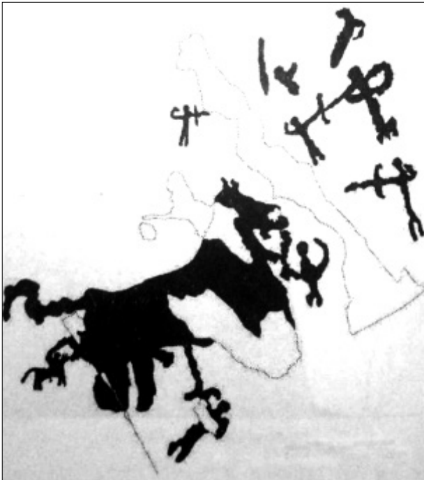
تصویر ۱۱- آنالیز خطی صحنه شکار اسب در دره نگاران

سنگ نگاره بعدی که در اینجا به آن پرداخته می شود حاوی صحنه ای بسیار جالب و نادر از شکار احتمالی یک اسب است که به دلیل فرسایش طبیعی دچار تخریب شده؛ ولی با بازسازی نقش در طرح می توان کلیت آن را دریافت کرد. در مرکزیت صحنه یک اسب با ابعادی بسیار بزرگ تر از سایرین نقش شده و در تصویر کردن این حیوان تناسب