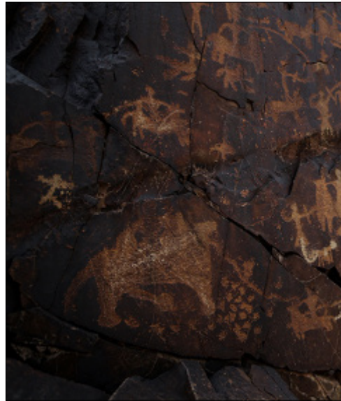
تصویر ۷- نقش موجودی شبیه به خرس در گوشه پایین صحنه جنگ در دره نگاران