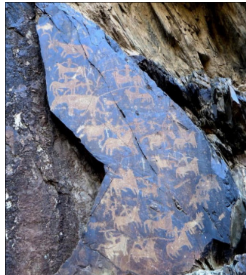
تصویر ۲۷- نقش سوارکاران در سنگ‌نگاره‌های دره نگاران

سنگ‌نگاره دیگری که در اینجا به آن پرداخته می‌شود را باید «صحنه سواران» نامید؛ چراکه به طور فشرده سوارکارانی را در کنار هم و با حالاتی مشابه نشان می‌دهد. تنوع نقوش و پرداختن به موضوعات مختلف، ولی تکراری، صحنه را از حالت یکنواخت و سکون رهنانیده است و نوعی آمیختگی میان سکون و تحرک پدید آورده است. در بالاترین قسمت این صحنه قوچ کوهی مجدداً تکرار شده است؛ ولی سایر نقوش جنگ و شکار را در کنار هم به نمایش گذاشته‌اند (تصویر ۲۷).