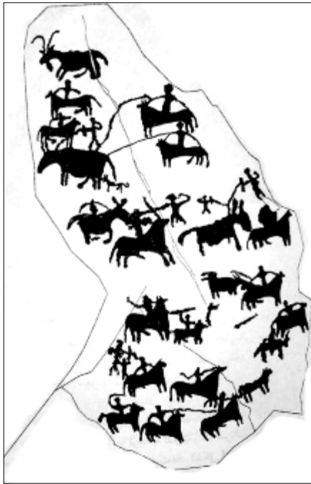
تصویر ۲۸- طرح آنالیز خطی صحنه سوارکاران در سنگ‌نگاره‌های دره نگاران