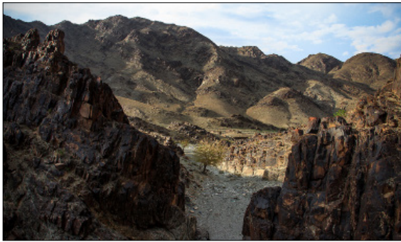
تصویر ۱- نمایی از دره نگاران