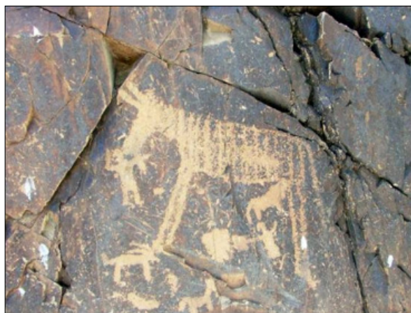
تصویر ۲۴- نقش مبارزه انسان‌ها با جانوری گول پیکر در دره نگاران

شکم گول را با شاخ‌هایش مورد حمله قرار داده است و دو حیوان دیگر نیز (احتمالاً یکی بز و دیگری سگ باشد) در زیر پای جانور گول آسا ترسیم شده‌اند (تصویر ۲۴).