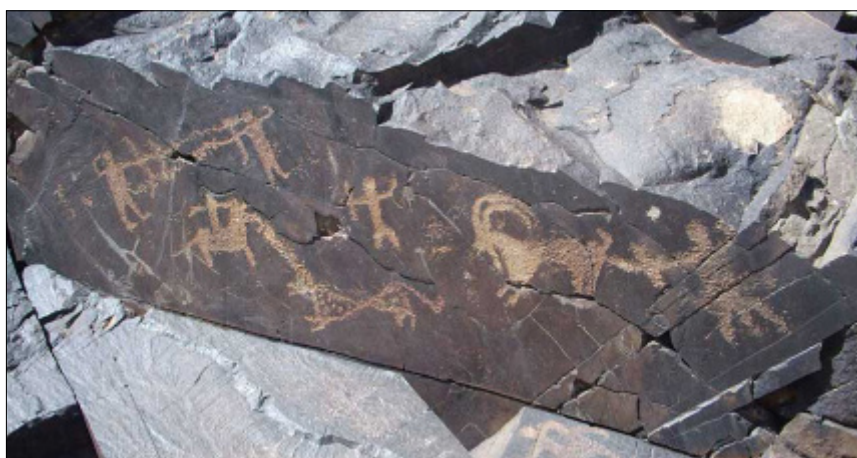
تصویر ۱۸- صحنه جنگ دو کمان دار، شکار پلنگ و شکار بز کوهی بر صخره در دره نگاران

نکته ضروری دیگر درباره این مجموعه آسیب هایی است که بر اثر فرسایش طبیعی بر آن وارد شده است. تفاوت دمای شب و روز که در مناطق کویری و خشک مانند بلوچستان رخ می دهد، به مرور زمان باعث ایجاد ترک هایی در سطح سنگ می شود و در نهایت با عمیق تر شدن شکاف، بخش هایی از سنگ فرومی ریزد. صحنه نقش بسته بر صخره جانبی این بخش که کوچک ترین صحنه این مجموعه است که از سه موضوع مختلف در کنار هم شکل گرفته است (تصاویر ۱۸ و ۱۹). در یک بخش، دو انسان در حال جنگ با تیرکمان هستند