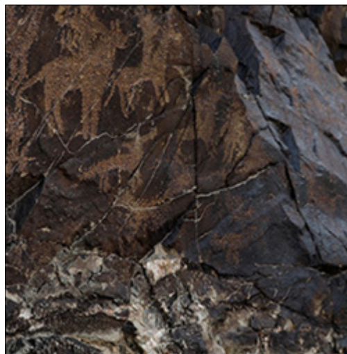
تصویر ۱۲- نقوش انسانی در بدنه شرقی دره نگاران