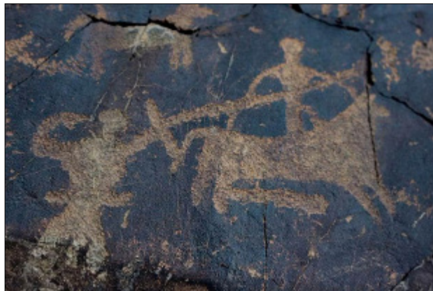
تصویر ۱۵- نقش مبارزه انسان اسب سوار و انسان پیاده در دره نگاران