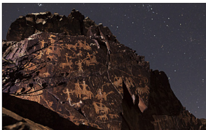
تصویر ۱۴- نقش سوارکاران و کمان‌داران در صخره میانی دره نگاران

بزرگ‌ترین سنگ‌نگاره دره نگاران دقیقاً رو به روی سنگ‌نگاره قبلی (تصویر ۱۲) قرار دارد. این سنگ‌نگاره بر سطح بخشی از صخره کم ارتفاع و جدا مانده از کوه اصلی و در مساحتی به ابعاد ۷۰۵ متر ایجاد شده است. این سنگ‌نگاره از چهار بخش کنار هم تشکیل شده است.