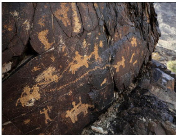
تصویر ۳- نقوش قسمت ورودی دره نگاران

را گرفته به نقش دیگری متصل می‌شوند، به‌وفور در دره نگاران وجود دارد (تصویر ۳).