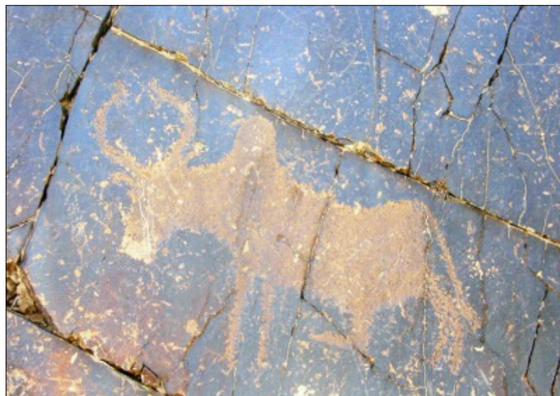
تصویر ۲۱- نقش گاو در سنگ‌نگاره‌های دره نگاران

Picture 20- The role of the mountain ram in the petroglyphs of Derenagaran