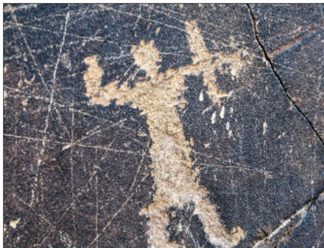
تصویر ۲۶- نقش انسان کمان‌دار در سنگ‌نگاره‌های دره نگاران

Picture 25- Two people fighting with a giant creature in the petroglyphs of Derenagaran