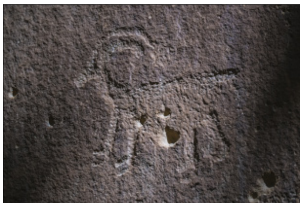
تصویر ۱۷- نقش قوچ کوهی در سنگ‌نگاره‌های دره نگاران

بیشتر نقوش این صحنه را سوارکارانی مشابه سایر سنگ‌نگاره‌های دره نگاران تشکیل می‌دهد و تنها در یک نمونه که تیراندازی روی اسب را نشان می‌دهد (پایین‌ترین قسمت صحنه)، منحصراً در این صحنه وجود دارد. از دیگر حیوانات باید به نقش بز کوهی اشاره کرد که بسیار زیبا و بادقت حک شده است (تصویر ۱۷).