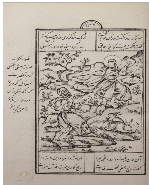
تصویر ۵: گریختن عیسی (ع) از احمق (مفتاح الملک، ۱۳۰۹: ۱۳۹)

تصویرسازی، قسمتی از داستان را نشان می‌دهد که عیسی (ع) از صحبت‌های فرد احمق ترسیده و در حال فرار از او به سوی کوه و صحرا است. در راه، مردی عیسی (ع) را در این حال می‌بیند و متعجب از او علت این عجله و فرار را جویا می‌شود. پس عیسی (ع) نیز در حال فرار علت را برای مرد توضیح می‌دهد.