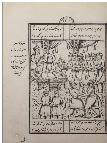
تصویر ۴: مجلس دادخواهی نزد داوود (ع) (مفتاح الملک، ۱۳۰۹: ۱۲۵)