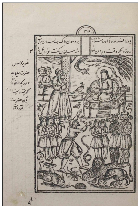
تصویر ۱: التماس مرد به سلیمان (ع) (مفتاح الملک، ۱۳۰۹: ۳۵)