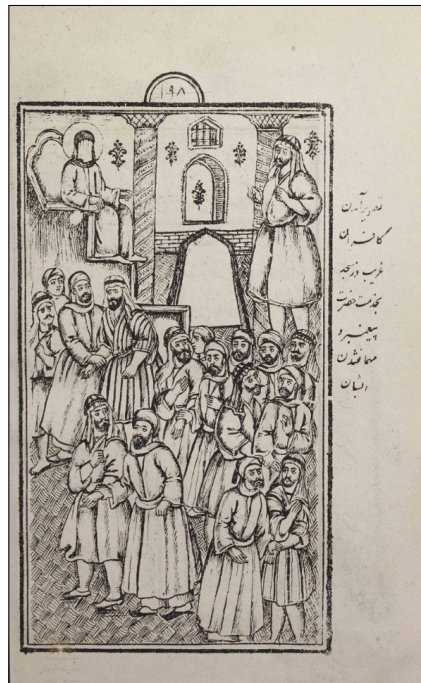
تصویر ۸: مهمان شدن کافران در خدمت پیغمبر (ص) (مفتاح الملک، ۱۳۰۹: ۱۹۸)

تصویرسازی، قسمتی از داستان را نمایش می دهد که کافران به مسجد رسیده و درخواست پناه دادن از سوی پیامبر (ص) را می کنند و هرکدام از اصحاب یکی از کافران را برای پذیرایی انتخاب نموده است. در این بین، یکی از کافران که فربه و چاق است تنها مانده و روبه روی پیامبر (ص) ایستاده است.