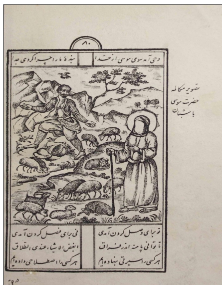
تصویر ۲: ملاقات موسی (ع) با چوپان (مفتاح الملک، ۱۳۰۹: ۸۰)