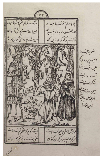
تصویر ۷: گم کردن حلیمه پیغمبر (ص) را (مفتاح‌الملک، ۱۳۰۹: ۱۷۲)

تصویر بخشی از داستان را روایت می‌کند که پیرمرد برای کمک به حلیمه برای یافتن محمد (ص) او را به بت‌خانه آورده است تا از بت‌ها کمک بگیرد، اما پیرمرد با آوردن نام کودک، باعث ترسیدن و شکست بت‌ها شده و با ترس و تعجب این صحنه را نگریسته و در پشت سر او حلیمه نیز از این منظره متعجب شده است.