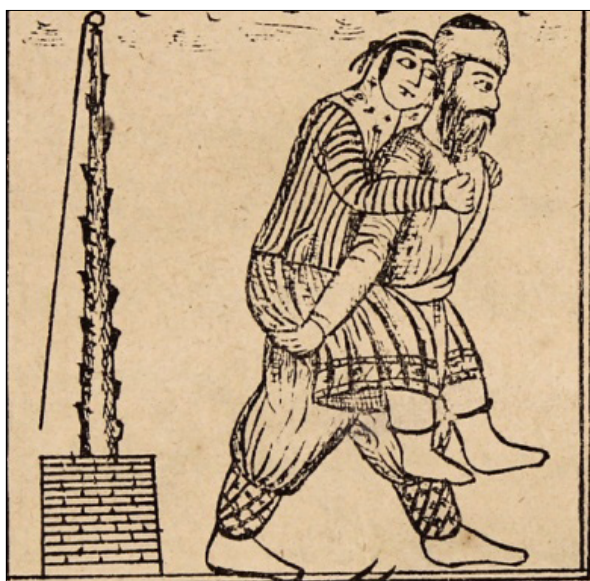
تصویر ۲۳: مرد خراسانی که دله را بر دوش گرفته و می‌برد (ناشناس، ۱۳۳۰: ۳۶)

در ادامه چنین آمده است که تا هفت شبانه روز دله را بر دار نگه داشتند و شکنجه دادند، ولی او اقرار نکرد. در شهر خراسان عیاری بود که خبر به گوش او نیز رسید و مشتاق شد تا به بغداد بیاید و دله را ببیند و هنر خود را به او نشان دهد. پس به بغداد رسید و دله را دید و از او خوشش آمد. تصمیم گرفت شبانه او را بدزدد. صبح مردم دیدند که دله را دزدیده‌اند و باز متحیر ماندند. چند مدتی گذشت مرد خراسانی به دله پیشنهاد داد تا به خراسان بروند و در آنجا زندگی کنند. پس با هم ازدواج کردند و به سوی خراسان به راه افتادند. در راه مرد خراسانی نامه‌ای به خلیفه نوشت و در آن بیان کرد که دله را من آزاد کرده‌ام. خلیفه نامه را خواند و حیران از مکر این دوش‌دو شد (تصویر ۲۳).