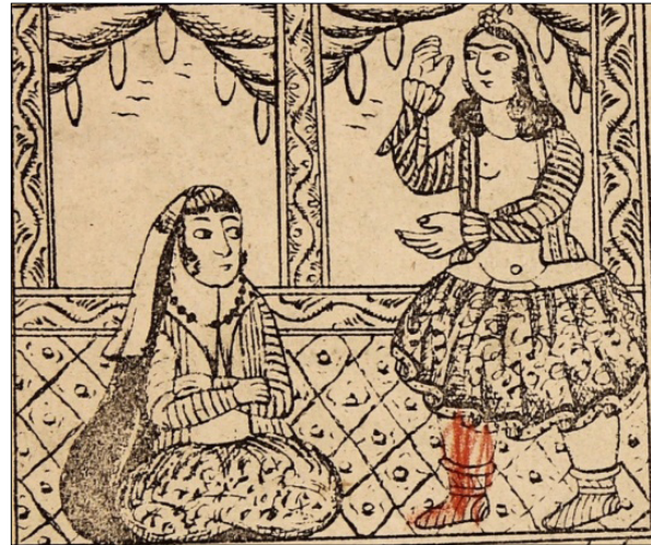
تصویر ۸: دله با زن خواجه (ناشناس، ۱۳۳۰: ۱۰)

در ادامه چنین آمده است که دله با هر نیرنگی که بود زن خواجه را رازی کرد. او چادرش را بر سر کرد و به سمت بازار آمد. دله به اطراف نگاه کرد و جوان صراف و خوش سیمایی را دید. دله پیش صراف رفت و گفت: ای جوان! دختر من