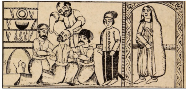
تصویر ۱۴: دندان کندن دلاک از خربنده و نگاه کردن دله (ناشناس، ۱۳۳۰: ۱۹) Figure 14: The Tooth Extraction of the masseur by the Tooth Puller and Delle's Observation (Anonymous, 1330: 19)