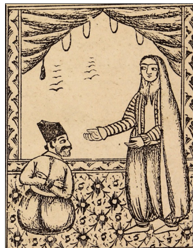
تصویر ۵: بستن مختار به دست رکابدار و دیدار با زن رکابدار (ناشناس، ۱۳۳۰: ۷) Figure 5: Mokhtar Tied by the Horseman and Meeting the Horseman's Wife (Anonymous, 1330: 7)

در ادامه چنین آمده است که چند روزی گذشت و از قضا رکابدار، مختار را دید و به او گفت که غلام تو شمشیر مرصع خلیفه را دزدیده است. مختار گفت: اتفاقاً همان روز از خانه من نیز دزدی کرده و به دنبال او می گردم و به سراغ او می روم. رکابدار مختار را گرفته و او را همراه خود به خانه آورد تا اسب خود را زین کند و به دنبال غلام بروند. ناگهان فردی به دنبال او آمد و پیغام آورد که خلیفه می خواهد تو را ببیند. رکابدار، مختار را در خانه بست و رفت. مدتی بعد زن رکابدار به خانه برگشت، مختار را در خانه دید. مختار با فریبکاری داستانی ساخت و زن را به شوهرش بدگمان کرد. زن نیز او را آزاد کرد (تصویر ۵).