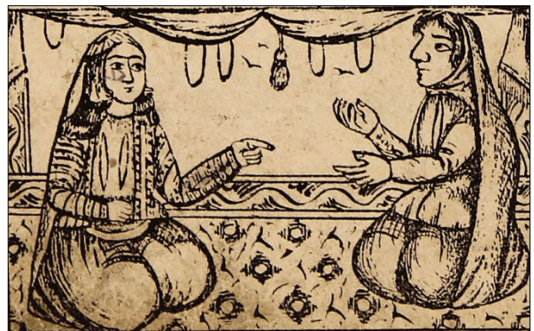
تصویر ۱: زن کاروانسرادار با دله (ناشناس، ۱۳۳۰: ۲)

در داستان مرتبط با تصویر اول چنین روایت شده است که در شهر بغداد دختری به دنیا آمد با ویژگی‌های اعجاب‌برانگیز و بسیار زیبا. آوازه حسن و جمال دختر عالم را گرفته بود و این دختر دله نام داشت. دختر بزرگ شد و خواب جوان عیاری را دید که مختار نام داشت و عاشق او شد. از آن پس تصمیم گرفت که با فردی که عیار و دلاور است، ازدواج کند. از قضا مختار که عیار و دلاور بود، به بغداد آمد و چند روزی را در کاروانسرای ماند. زن کاروانسرادار دله را برای ازدواج به او پیشنهاد داد. زن کاروانسرادار چادر بر سر کرد به اندرونی خانه دله برای خواستگاری رفت (تصویر ۱).