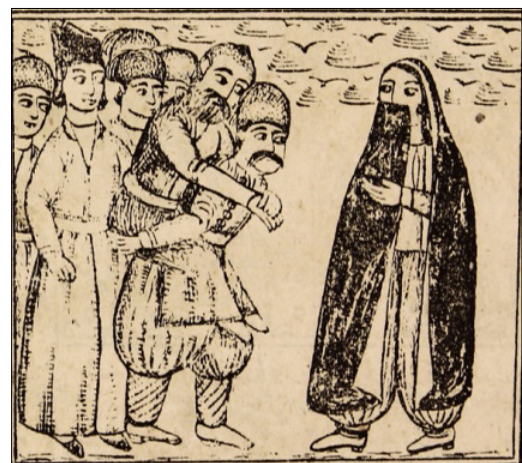
تصویر ۱۳: جمع آمدن مردم به دور گازر (ناشناس، ۱۳۳۰: ۱۷)

مدتی گذشت و گازر دله را دید و جلوی او را گرفت و گفت: ای دله! سه سال است که من به دنبال تو هستم و تو را آنچنان خواهم کشت که مبدل به عبرت خلق شوی. گازر این سخنان را می‌گفت و فریاد می‌کشید که مردم به دور آن‌ها جمع شدند. دله رو به آسمان کرد و گفت: خدایا حرف‌های فرزند مرا نشنیده بگیر، او دیوانه شده و می‌خواهد مرا بکشد و من درمانده‌ام و نمی‌دانم که با او چه کنم. مردم وقتی سخنان دله را شنیدند، گمان کردند که گازر فرزند دله است و او را چنان زدند که بی‌هوش شد. بعد او را به دارالشفای بردند. دله وسایل گازر را برداشت و رفت. تا اینکه چهل روز گذشت و بستگان گازر در بازار به دنبال او آمدند. فردی گفت: من او را در دارالشفای دیده‌ام و گفته‌اند که او دیوانه شده است. پس به دنبال او رفتند و شحنة را خبر کردند. او وقتی گازر را در این حالت دید، به او جامه و مقداری پول داد و گفت: این زن مکار را پیدا می‌کنیم و به جزای اعمالش میرسانیم (تصویر ۱۳).