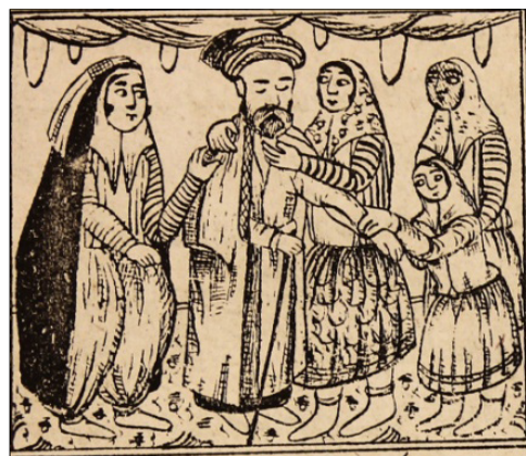
تصویر ۱۶: نایینا با دختران دله (ناشناس، ۱۳۳۰: ۲۲) Figure 16: The Blind Man with Delle's Daughters (Anonymous, 1330: 22)

در ادامه چنین آمده است که دله در راه خانه به دخترش گفت: زودتر به خانه برو و داستان را برای خواهرانت تعریف کن. دخترانش پیش آن‌ها آمدند و حرف‌های دله را تکرار می‌کردند. نایینا که متعجب شده بود، شکر خدا را گفت که تا دیروز گدایی می‌کرده و حال توانگر شده است. از او پذیرایی کردند و جامه نو بر او پوشاندند و خرقه‌اش را که زرد داشت از تن او درآوردند. چند روزی گذشت تا اینکه نایینا به دله گفت: من می‌دانم که شوهر تو نیستم، بگو برای چه من را به خانه‌ات آورده‌ای؟ دله به او گفت: من شوهری داشتم که مال و ثروت بسیاری داشته و فوت شده است. برای اینکه کسی از مال و ثروت من نگهداری کند، تو را پیدا کردم (تصویر ۱۶).