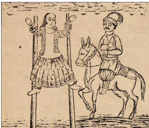
تصویر ۲۲: بردار کشیدن دله (ناشناس، ۱۳۳۰: ۳۴)

در ادامه چنین آمده است که بعد از گذشتن یک سال، دله دوباره از خانه بیرون آمد تا فریبی دیگر به پا کند. عده‌ای او را دیدند و شناختند و او را گرفته و می‌زدند. دله نیز فریاد می‌زد که به چه گناهی مرا گرفته‌اید، من دله نیستم. جماعت او را کشان‌کشان به نزد خلیفه آوردند و برای خلیفه گریه و زاری کرد که من دله نیستم و اشتباه گرفته‌اید خلیفه به شحنة دستور داد تا او را به میدان شهر ببرند و به دار بیاویزند و مجازات کنند تا اقرار کند. او را بردار کردند و هر مجازاتی که بود انجام دادند، اما او به دله بودن اقرار نکرد تا اینکه روز گرم شد و همه به خانه رفتند و دله همان‌جا بردار ماند. جوانی که از ده می‌آمد به میدان رسید. دله جوان را دید که بر استر سوار است. با فریب او را خام و غلامش را که در آن نزدیکی بود گفت: تا استر جوان روستایی را بردارد و به خانه برود (تصویر ۲۲).