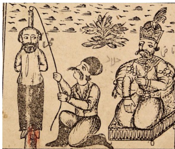
تصویر ۷: دارزدن مختار توسط پادشاه (ناشناس، ۱۳۳۰: ۹)

در ادامه چنین آمده است که پس از دستگیری مختار و بردن او به نزد خلیفه، مردم جمع شدند و هر یک از فریب‌ها و دزدی‌هایی که مختار انجام داده، سخن گفتند. خلیفه دستور داد تا او را به دار بیاویزند (تصویر ۷).