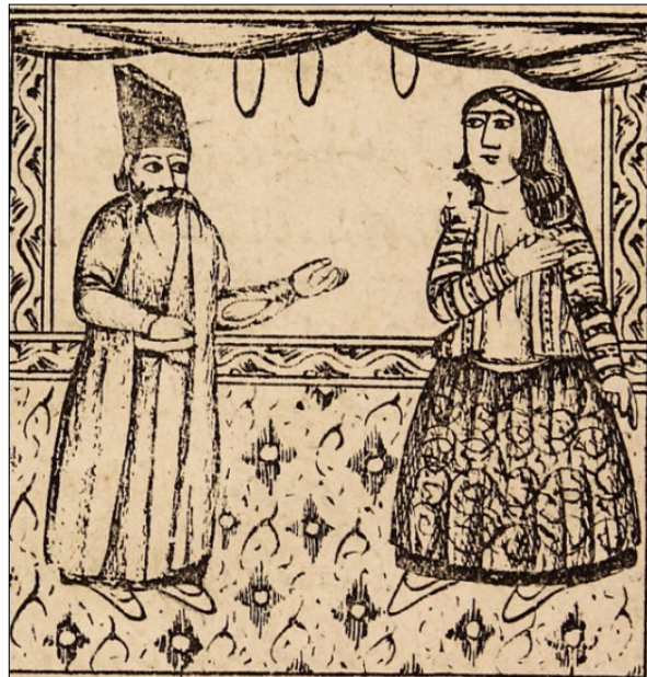
تصویر ۲: اولین دیدار دله با مختار (ناشناس، ۱۳۳۰: ۳)