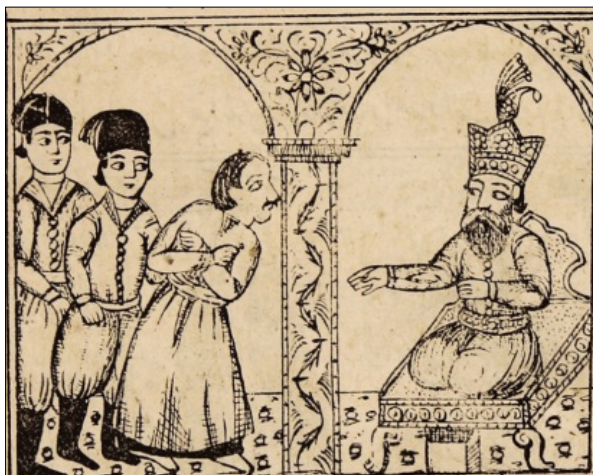
تصویر ۱۲: جماعتی که صراف را گرفته و دست بسته نزد شحنة آوردند (ناشناس، ۱۶: ۱۳۳۰)