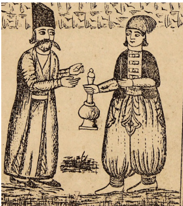
تصویر ۳: شربتدار با مختار (ناشناس، ۱۳۳۰: ۴)

در ادامه چنین آمده است که خلیفه متوجه دزدی شد و دستور داد تا دزد را پیدا کنند. روزی مختار تصمیم گرفت مشربۀ طلا را بفروشد. به بازار رفت. از قضا شربتدار خلیفه مشربه را شناخت، اما مختار که با حرف‌های او را خام کرده بود، او را به نزد بازرگانان فرستاد تا مشربه را بفروشد. در همین حال که شربتدار در حال فروش مشربه بود، مختار سر رسید و گفت: ای مردم این مرد این مشربه را از شربتخانه خلیفه دزدیده است. خلیفه آمد و شربتدار بیچاره را گرفته و مجازات کردند و خلیفه برای این کار مختار، به او پاداش داد (تصویر ۳).