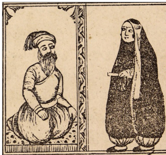
تصویر ۱۹: ابونواس با دله (ناشناس، ۱۳۳۰: ۲۷) Figure 19: Abu Nawas with Delle (Anonymous, 1330: 27)

گفت که من دایه پسر هستم و او مرا نزد تو فرستاده تا قرار ملاقاتی با هم بگذارید. ابونواس خوشحال شد و به او مزدگانی داد. نامه‌ای نوشت و نزد پسر فرستاد. پسر جوان با خواندن نامه بسیار عصبانی شد. قلم برداشت و نامه‌ای به صد هزار زشتی نوشت و گفت: اگر بار دیگر از این حرف‌ها بنویسی کاری می‌کنم که تمام مردم بغداد از نیت تو آگاه شوند. ابونواس که نامه را دید فهمید که فریب دله را خورده است و به نزد خلیفه رفت (تصویر ۱۹).