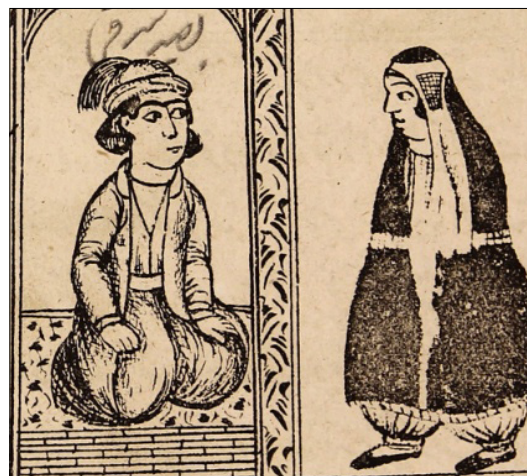
تصویر ۱۸: دله و پسر جواهر فروش (ناشناس، ۱۳۳۰: ۲۵)

در ادامه چنین آمده است که یک روز دله برای فریب و صیدی دیگر از خانه بیرون آمد که ناگهان پسر جوانی را دید که صورتی زیبا داشت. لباسی شاهانه پوشیده و عمامه‌ای از جنس حریر به سر بسته و در دکان جواهر فروشی نشسته بود. دله پیش پسر رفت. پسر زنی دید در نهایت زیرک و زرنگ. دله گفت: دختر فضل بن یحیی برمکی مراند تو فرستاده و روزی تو را دیده و عاشقت شده است. به من زرداده و از من خواسته تا نزد تو بیایم، اما پسر بسیار عصبانی شد و گفت: بامن از این سخن‌ها مگو و دله از او ناامید شد (تصویر ۱۸).