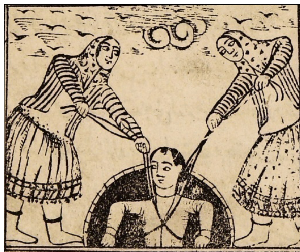
تصویر ۲۱: مرد برهنه و زنان برگرد او (ناشناس، ۱۳۳۰: ۳۰)

دیگر از خانه بیرون آمد. زنی را در راه دید و با او هم صحبت شد. در این میان جوانی به دنبال آنان به راه افتاد. دله گفت: ای جوان چرا دنبال ما می‌آمدی؟ او گفت: من از این زن خوشم آمده است. دله گفت: دل به دل راه دارد بیا که این زن هم تو را دیده و از تو خوشش آمده. او مکر دیگری به کار گرفت و جوان را به دنبال خود کشاند. پس وارد خانه‌ای شد و به بهانه برداشتن آب از چاه او را در چاه رها کرد و جامه‌هایش را برداشت و رفت. مدتی گذشت. اهل خانه بیرون آمدند و کسی را ندیدند. بر سر چاه رفتند و دیدند جوانی فریاد می‌زند و کمک می‌خواهد. زنان جمع شده و به هر حیلۀ ای که بود او را از چاه بیرون کشیدند. جوان لباس‌هایش را خواست. آن‌ها گفتند: مادرت به خانه برده. جوان فهمید که او دله بوده. مجبور شد عریان و شرمسار، به خانه برود. این خبر را به خلیفه دادند و او گفت: در پی این زن باشید که شر او را از خلق کم کنیم و همه در طلب دله در آمدند (تصویر ۲۱).