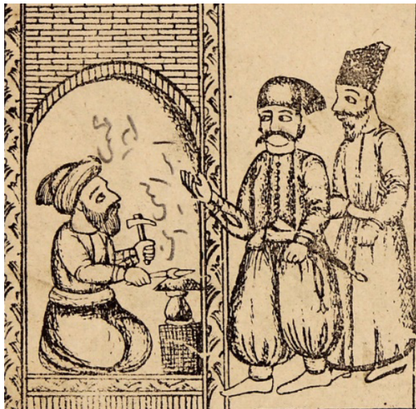
تصویر ۴: آمدن رکابدار و شمشیرساز به دکان زرگر (ناشناس، ۱۳۳۰: ۶)

کارش تمام شد اسبش را برداشت و به مغازه شمشیرساز رفت و از او طلب شمشیر خلیفه را کرد، اما شمشیرساز گفت: غلام شما همراه با اسبتان آمد و شمشیر را گرفت. رکابدار بسیار عصبانی می‌شود (تصویر ۴).