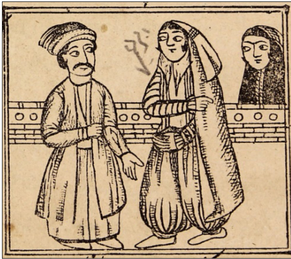
تصویر ۹: دله با جوان صراف (ناشناس، ۱۳۳۰: ۱۱)

که آن دور ایستاده، دل به تو داده است. از من خواسته تا تو را به نزد او ببرم. صراف به زن نگاهی کرد و زن زیبایی را دید و قبول کرد. دله به او گفت: اگر در اینجا خانه داری بروید و ساعتی را در کنار هم بنشینید. دله صراف و زن خواجه را برداشت و به راه افتاد تا به دکان گازی (رخت شوی، لباس شوی) رسیدند (تصویر ۹).