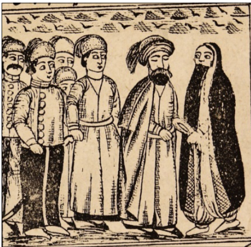
تصویر ۱۵: دله با نابینا و جمع شدن مردم به دور آن‌ها (ناشناس، ۱۳۳۰: ۲۱) Figure 15: Delle with the Blind Man and the Gathering of People Around Them (Anonymous, 1330: 21)

در ادامه چنین آمده است که یک سال از حيله دله گذشت که او برای صیدی دیگر لباس‌های آراسته پوشید و انگشتر در دست و گوشواره‌های مرصع به گوش کرد و از خانه به همراه دخترش بیرون آمد. به مسجدی رسیدند. در آنجا نابینایی را دیدند که گدایی می‌کند. به دنبال او رفته و داد و فریاد کرد که ای حرامزاده چرا خانه خود را ترک کرده و زن و فرزندان را رها کرده‌ای. تو با این همه مال و دارایی خجالت نمی‌کشی گدایی می‌کنی؟ مردم به دور آن‌ها جمع شدند و وقتی دله را با آن آراستگی و جمالی دیدند متعجب شدند که این زن نیکو چگونه برای این نابینا گریه و زاری می‌کند. نابینا هرچه انکار کرد که او را نمی‌شناسم، هیچ کس باور نکرد. نابینا با خود فکر کرد که این زن حتما شوهری داشته به خانه او بروم تا فرزندانش مرا ببینند و بشناسند که من شوهر او نیستم و بعد از آنجا بیرون می‌آیم (تصویر ۱۵).