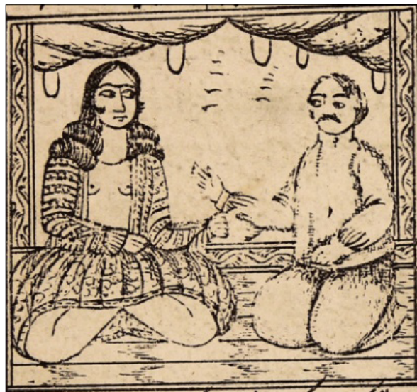
تصویر ۱۰: برهنه شدن مرد صراف با زن خواجه (ناشناس، ۱۳۳۰: ۱۴)

در ادامه، دله به نزد گازر آمد و با فریبکاری او را راضی کرد که آن دو، ساعتی در بالاخانه دکان او بنشینند و به گازر پول داد تا برای آنان کباب بخرد. سپس هر آنچه در دکان بود و لباس های زن و مرد صراف را برداشت و با استر خربنده رفت وقتی آنان متوجه مکر او شدند به نزد خلیفه رفتند. خلیفه دستور داد هر چه زودتر دله پیدا شود و خربنده و گازر را آزاد کرد و صراف و زن خواجه را جریمه کرد تا عبرت دیگران شوند (تصویر ۱۰).