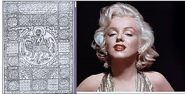
تصویر ۵ - سمت راست: عکس مریلین مونرو، (Ur12)؛ سمت چپ: تعویذ اسلامی (Ur14)