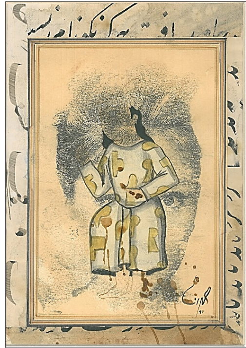
تصویر ۲- آدری هپبورن، اثر مه‌رانا زاری، تاریخ ساخت ۱۳۹۶ ه.ش.، اندازه ۳۰×۲۰ سانتیمتر، کلاژ چاپ دستی و خوشنویسی (Url4)

ریچارد دایر ۱ منتقد مطرح فیلم در مطالعه خود در مورد تصویری از مریلین مونرو، استدلال می‌کند که موهایی بلوند پلاتینوم رنگ شده‌ی وی برای جذابیت جنسی او مهم است، به‌ویژه که توسط گفتمان‌های رایج دهه ۱۹۵۰م. ساخته و پرداخته شده است: «مونرو بخشی از ساخت آن چیزی است که با مطلوب‌ترین زن، که یک زن سفیدپوست است کاملاً مطابقت دارد. یک همبازی معمولی سفید است، و اغلب اوقات بلوند ایده آل برای مونرو باید سفید باشد، و نه تنها سفید بلکه بلوند، بی‌ابهام‌ترین سفیدی که می‌توانید از آن به دست آورید». مونرو به‌عنوان یک بلوند در صنعت فیلم هالیوود در دهه ۱۹۵۰م. تجسم جنسی و نژادی کمال محسوب می‌شد. در دوره‌ای از جنبش‌های حقوق مدنی، استعمارزدایی و شورش‌های نژادی که دیدگاه هالیوود درباره مطلوبیت جنسی زنان، نماد سفید درخشان بود. (Handyside, 2010: 291-292) معنای مستتر در رنگ سفیدی مونرو در رابطه با صادرات فیلم‌های وی به فرانسه است. سفیدی مونرو نشانگر نژادپرستی نهادینه‌ای است که هالیوود دهه ۱۹۵۰م. را توصیف می‌کند. همان‌طور که خانم لوئیس بانر ۲ استدلال می‌کند، این امکان وجود دارد که اکثر بازیگران