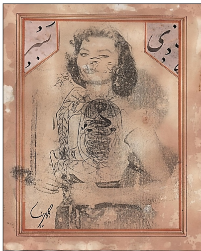
تصویر ۶- سوفیا لورن، اثر مهرانا زاری، تاریخ ساخت ۱۳۹۷ ه.ش، اندازه ۳۰×۲۰ سانتیمتر، کلاژ چاپ دستی و خوشنویسی (Ur14)

مشق نویسی در دو طرف اثر) می‌شوند. نکته‌ای که در تصویر شماره سه قابل ذکر است این است که تنها در این تصویر، سوفیا تنها سوژه‌ای است که در قید حیات است و نیز تراکونگی درونی از نوع حذف صورت نگرفته، چراکه لباس سوفیا در این اثر دارای آستینی هرچند کوتاه بوده و هنرمند به‌ناچار تمهیدی را برای پوشاندن یقه‌ باز سوفیا اندیشیده است که با کنایه‌ای ظریف [ایجاد حس اشمئزاز در رویارویی اولیه با اثر] همراه است؛ بدین‌صورت که نگاره تشریح بدن از کتاب قانون پورسینا را بر روی قفسه سینه لورن جایگذاری کرده است. شاید این جایگذاری معانی ضمنی دیگری داشته باشد؛ نظیر این‌که زندگی اغلب ستارگان هالیوود و خصوصاً زنان بازیگر، تحت تأثیر جو زمانه بوده و مسئله‌ای تحت عنوان "حریم خصوصی" ۳ بازیگران در آن دوره معنی و مفهوم امروزی را نداشته و یا حداقل پایبندی به آن از سوی رسانه‌ها کم‌تر بوده است. به عبارت بهتر گویی لورن چیزی را برای پنهان کردن و از دست دادن ندارد و تمام زوایای پیدا و پنهان زندگی او در اختیار رسانه‌ها و پاپاراتزی‌ها ۴ بوده است.