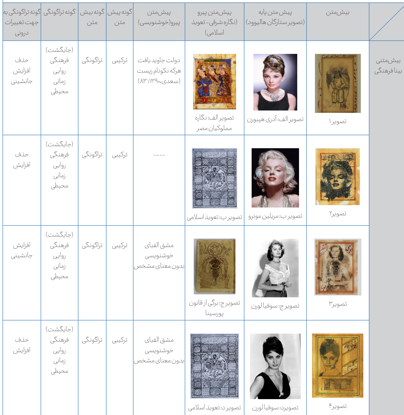
Table 1: Intertextual Relationships in Mehrana Zarei's Works (Table design by the writer)

جدول یک- روابط بیش متنی در آثار مهرانا زارعی (طرح جدول از نگارنده)