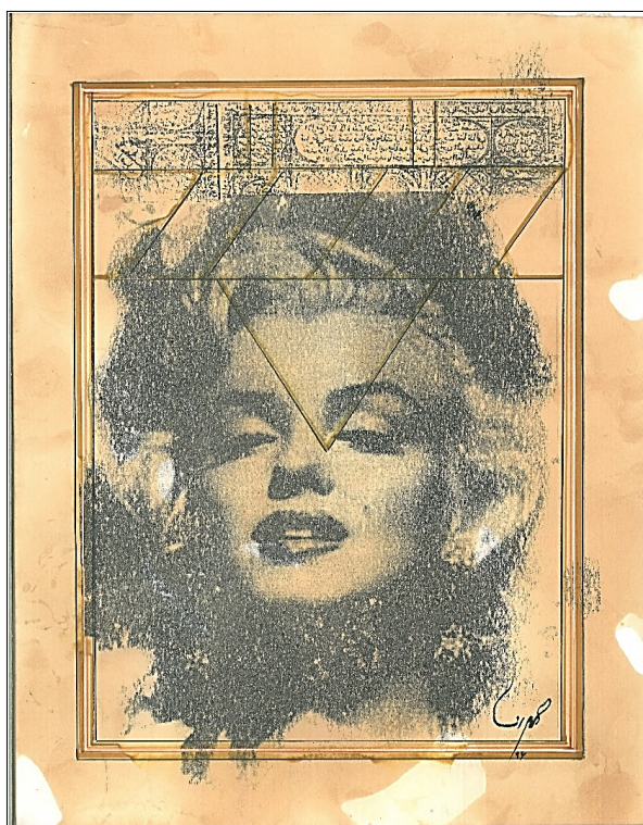
تصویر ۴- مریلین مونرو، اثر مهرانا زاری، تاریخ ساخت ۱۳۹۶ ه.ش.، اندازه ۳۰ دره سانتیمتر، کلاژ چاپ دستی و خوشنویسی (Url4)

گیرد، در بین نظام‌های نشانه شناختی نماینده عنصر زنانه و زنانگی تلقی می‌شود. ژان شوالیه در این باره معتقد است که مثلث با رأس در پایین، نماد آب و آلت زنانه (رحم) است (شوالیه، ۱۳۸۷، ج ۵: ۱۵۳-۱۵۴). از طرفی حالت متزلزل و بی‌ثبات این مثلث از منظر مبانی هنرهای تجسمی و همچنین محصور نشدن کامل مونرو در جدول کشی نگاره و از کادر خارج شدن آن در پایین صفحه می‌تواند ارتباطی ضمنی با زندگی شخصی ناپسامان مونرو به لحاظ اخلاقی و نداشتن تعادل روحی-روانی وی منطبق گردد که در نهایت منتهی به خودکشی وی شد. همچنین نوشته ادعیه و تعویذ استفاده شده در بخش بالای نگاره به دلیل این که به روش چاپ دستی انجام پذیرفته، فاقد وضوح بوده و ادعیه مرکزی قابلیت خوانش ندارد. اما بخشی از قسمت "چشم زخم" و همچنین سورمبار که ناس و فلق در بالای تعویذ در بالای نگاره استفاده شده است.