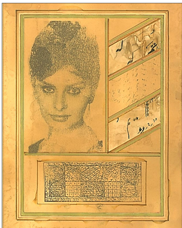
تصویر ۸- سوفیا لورن، اثر مهرانا زارعی، تاریخ ساخت ۱۳۹۶ ه.ش.، اندازه ۳۰ دره سانتیمتر، کلاژ چاپ دستی و خوشنویسی (Ur14)

در این فرآیند اقتباسی است که حتی در حذف پوشش او نیز خودنمایی می‌کند. شاید بتوان این اثر را آرزویی شامل دوگانه‌ای از تقابل فرهنگ غرب (چهره سوفیا) و فرهنگ ایرانی (خوشنویسی نستعلیق) در نظر گرفت که امید است توسط تعویذ اسلامی محافظت شود.