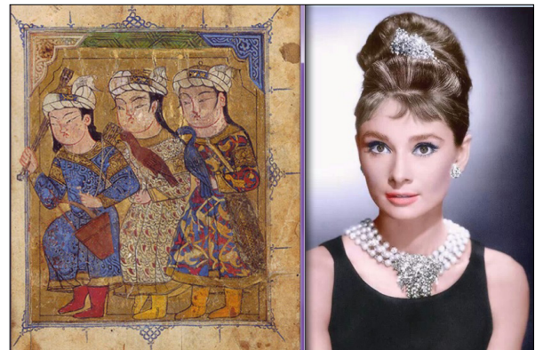
تصویر ۳- الف- سمت راست: آدری هپبورن (Url13)؛ سمت چپ: نگاره سه شکارچی جوان، آبرنگ مات و طلا روی کاغذ، نگارگر احتمالاً ابن مظفر، دوره سلوان الموتا؟، سلطان مملوک مصر، تاریخ حدوداً ۷۲۵-۷۵۰ ه.ق. (Url6)