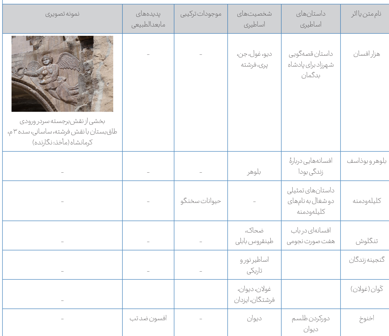
Table 2 - Manifestations of Wonders in Texts and Works from the Sasanian Era and Early Islamic Period

جدول ۲- نمودهای عجایب نگاری در متون و آثار عصر ساسانی و دوران اولیه اسلامی.