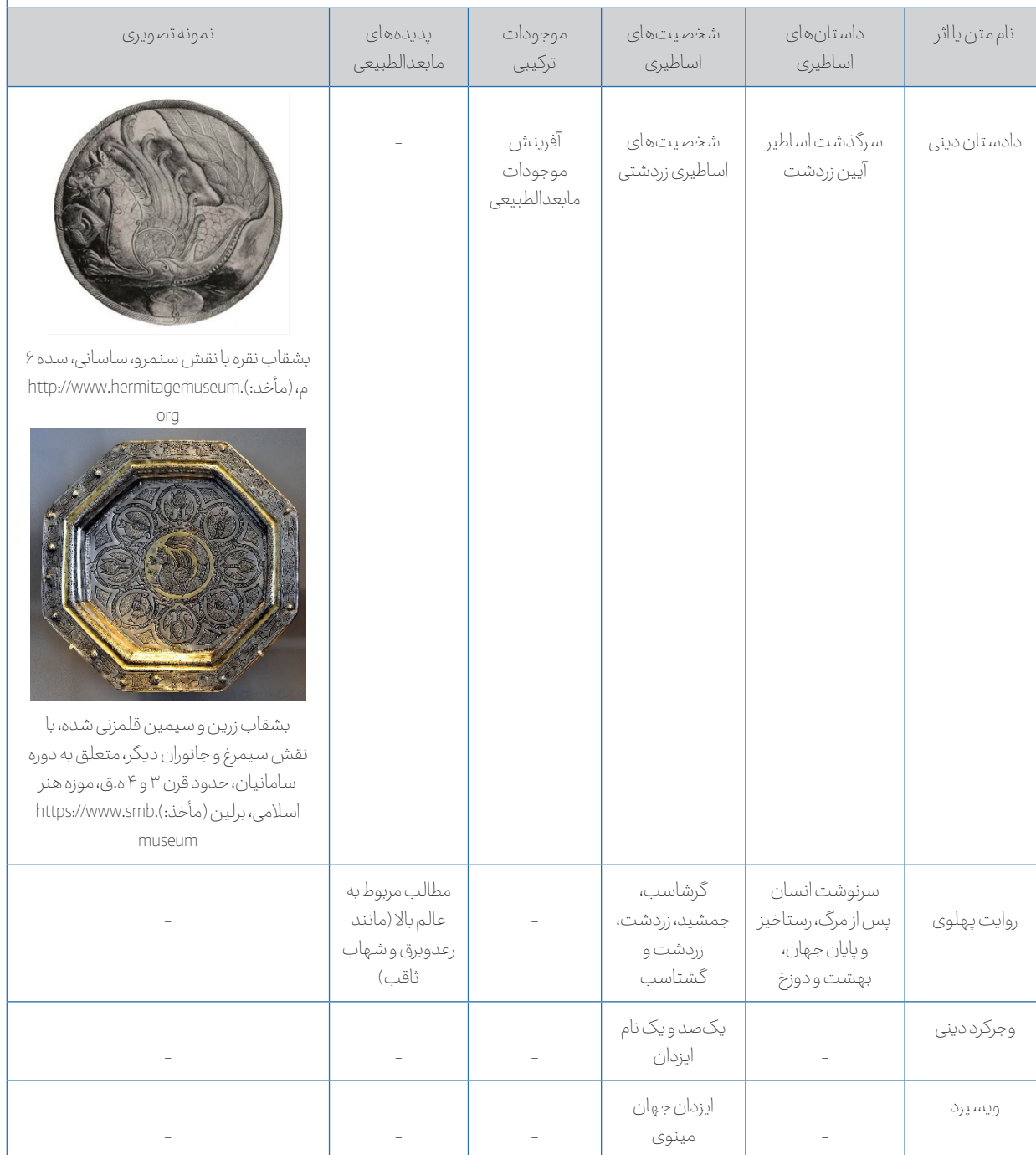
Table 2 - Manifestations of Wonders in Texts and Works from the Sasanian Era and Early Islamic Period

جدول ۲- نمودهای عجایب نگاری در متون و آثار عصر ساسانی و دوران اولیه اسلامی.