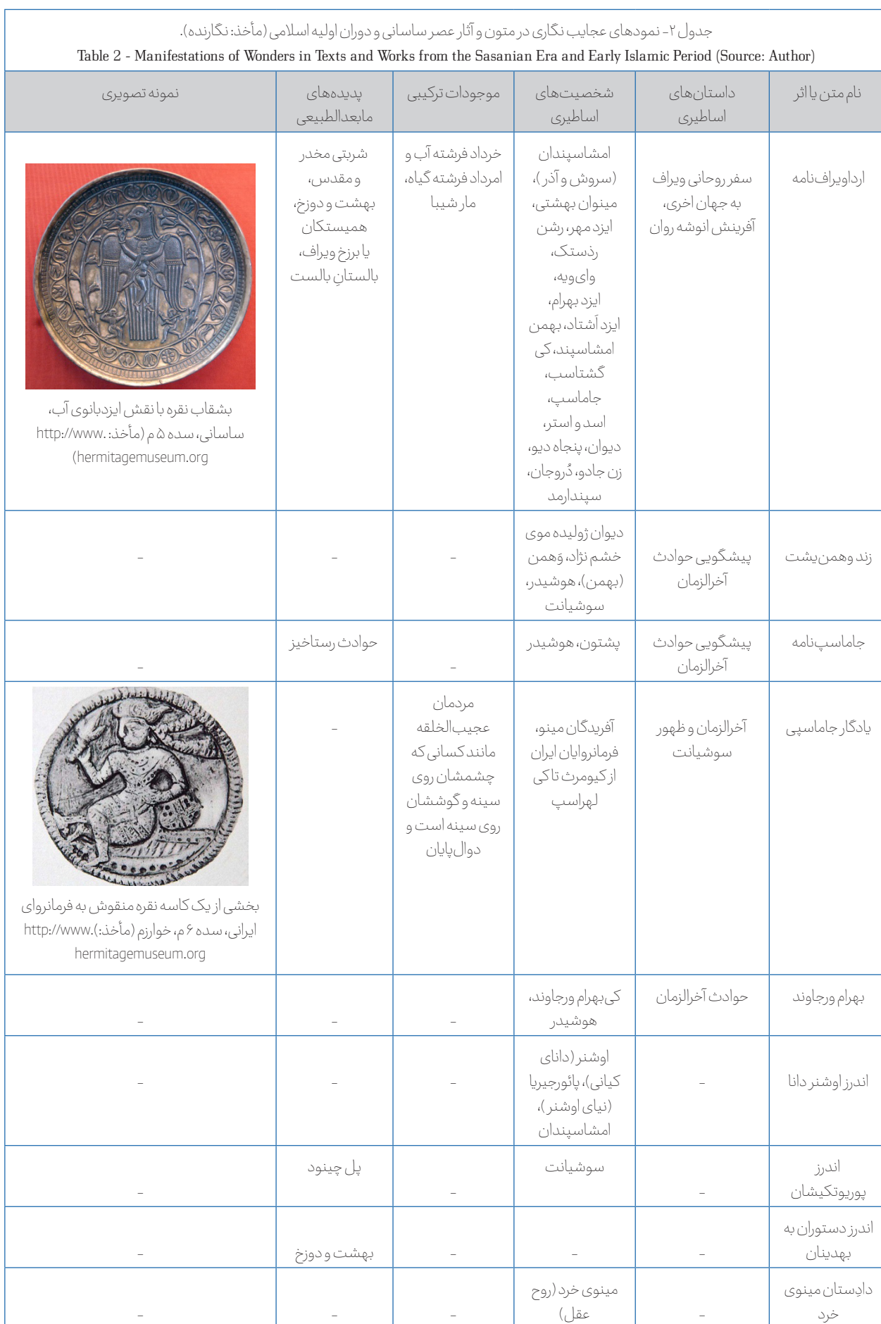
Table 2 - Manifestations of Wonders in Texts and Works from the Sasanian Era and Early Islamic Period

بشقاب نقره با نقش ایزدبانوی آب، ساسانی، سده ۵ م