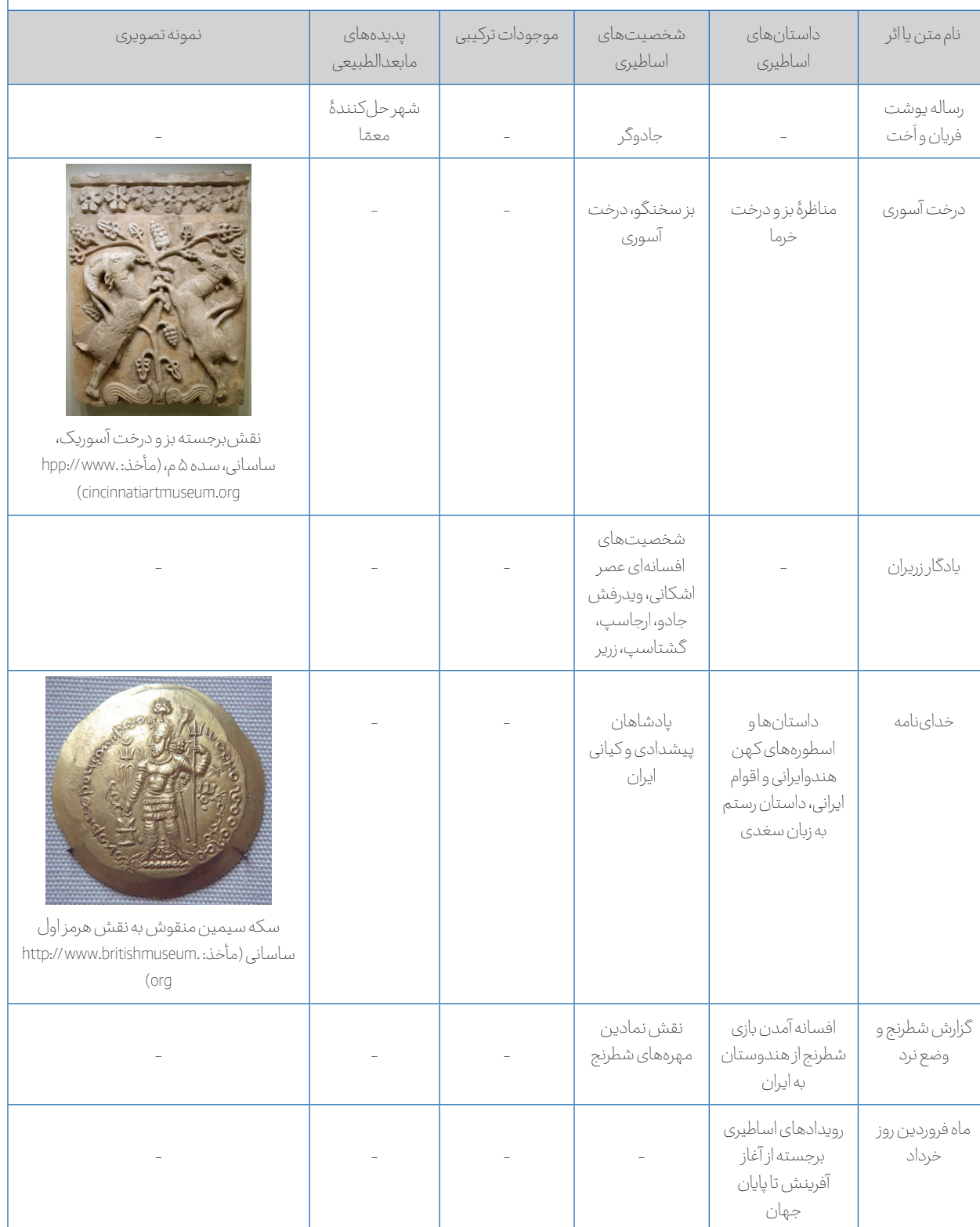
Table 2 - Manifestations of Wonders in Texts and Works from the Sasanian Era and Early Islamic Period

جدول ۲- نمونه‌های عجایب نگاری در متون و آثار عصر ساسانی و دوران اولیه اسلامی.