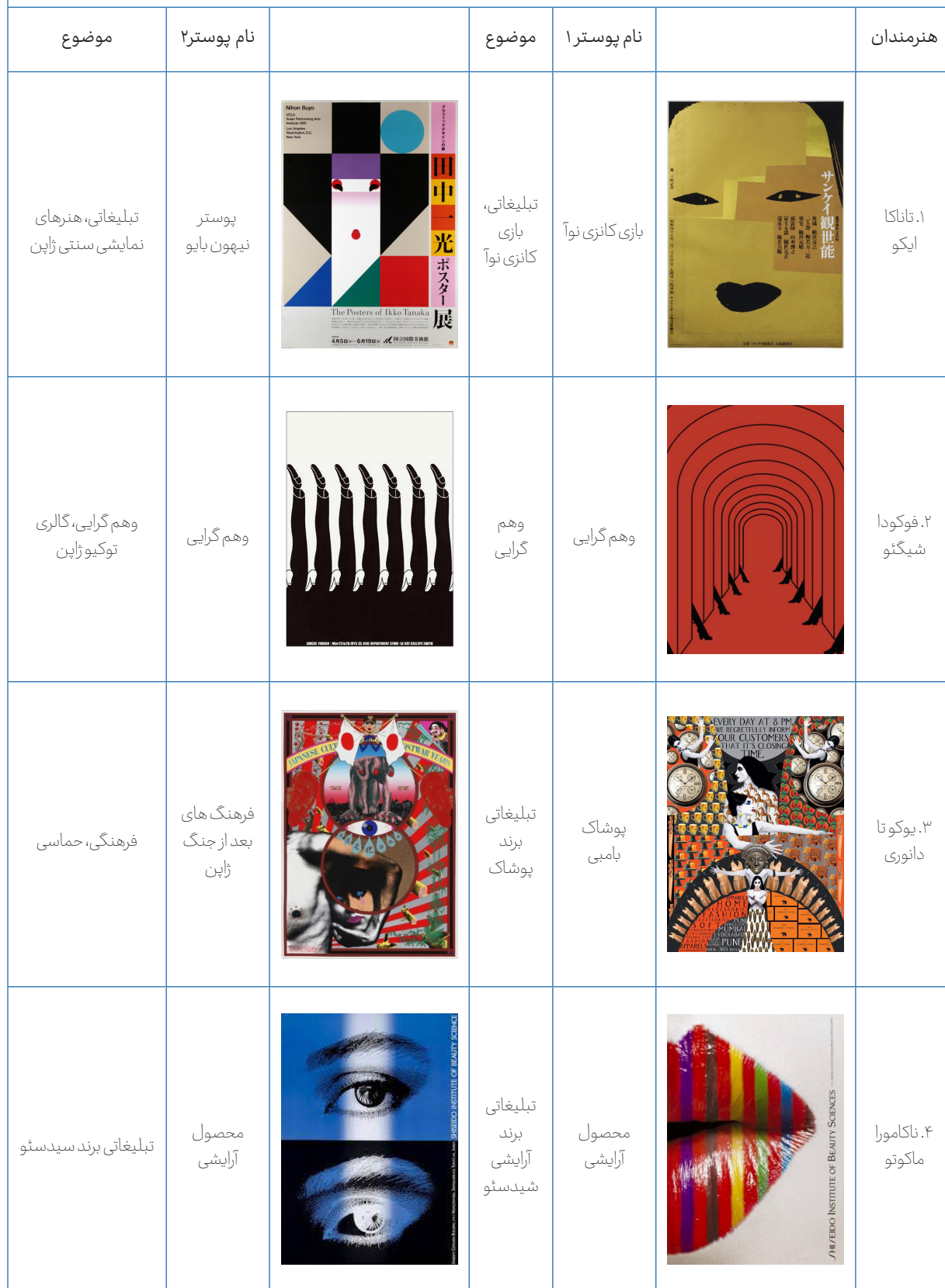
Table 1: Selected Artists and Works